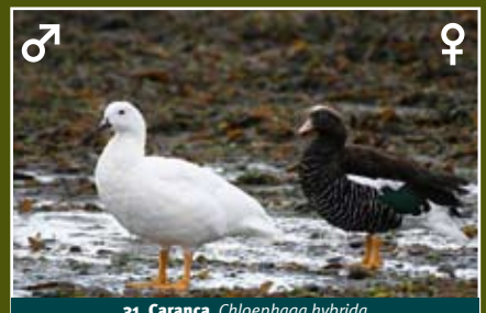
31. Caranca, Chloephaga hybrida