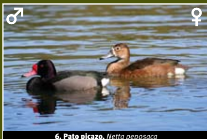
6. Pato picazo, Netta peposaca