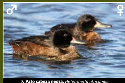
7. Pato cabeza negra, Heteronetta atricapilla