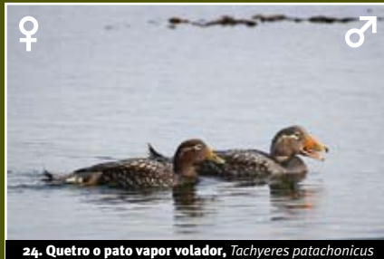
24. Quetro o pato vapor volador, Tachyeres patachonicus