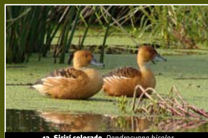
13. Sirirí colorado, Dendrocygna bicolor