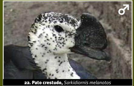
22. Pato crestado, Sarkidiornis melanotos