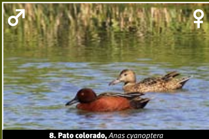
8. Pato colorado, Anas cyanoptera