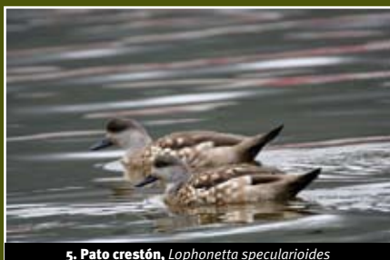
5. Pato crestón, Lophonetta specularioides