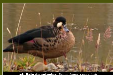
16. Pato de anteojos, Specularnas specularis