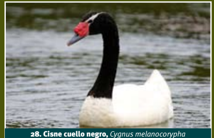
28. Cisne cuello negro, Cygnus melanocorypha