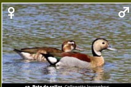
12. Pato de collar, Callonetta leucophrys