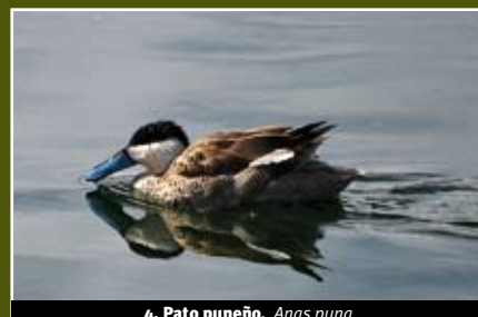
4. Pato puneño, Anas puna