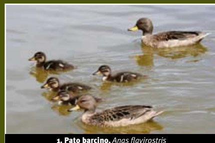
1. Pato barcino, Anas flavirostris