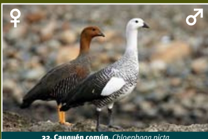
32. Cauquén común, Chloephaga picta