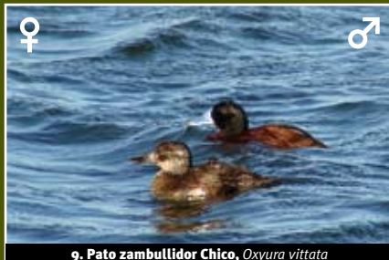
9. Pato zambullidor Chico, Oxyura vittata