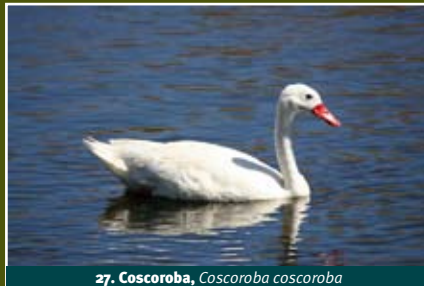
27. Coscoroba, Coscoroba coscoroba