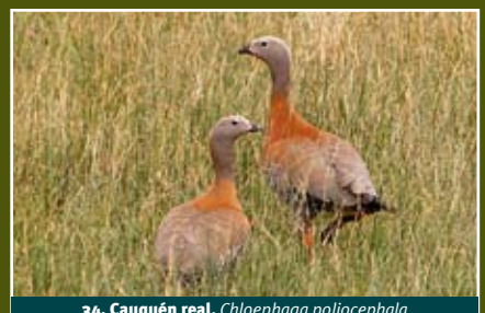
34. Cauquén real, Chloephaga poliocephala