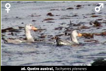
26. Quetro austral, Tachyeres pteneres