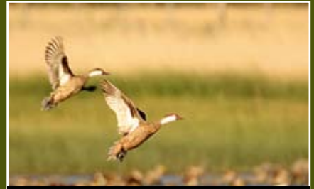
19. Pato gargantilla, Anas bahamensis