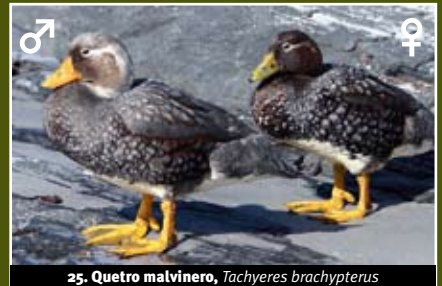
25. Quetro malvinero, Tachyeres brachypterus