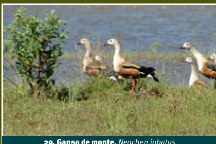
29. Ganso de monte, Neochen jubatus