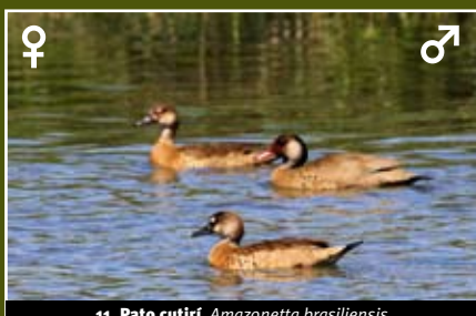
11. Pato cutirí, Amazonetta brasiliensis