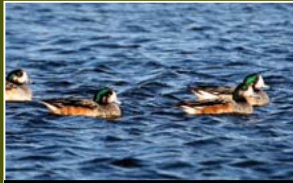
18. Pato overo, Anas sibilatrix