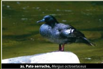
21. Pato serrucho, Mergus octosetaceus