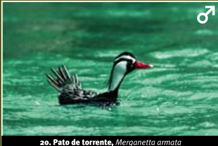
20. Pato de torrente, Merganetta armata