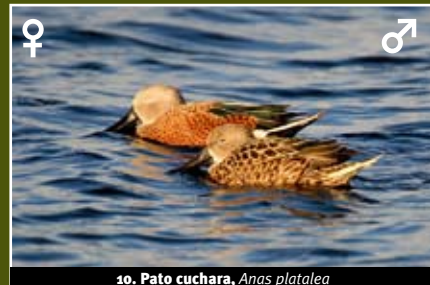
10. Pato cuchara, Anas platalea