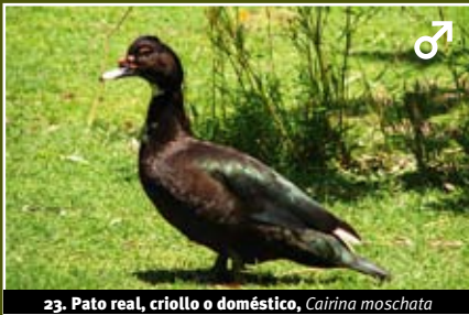
23. Pato real, criollo o doméstico, Cairina moschata