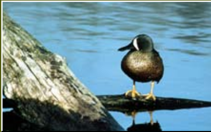
17. Pato media luna, Anas discors