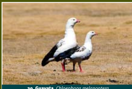
30. Guayata, Chloephaga melanoptera