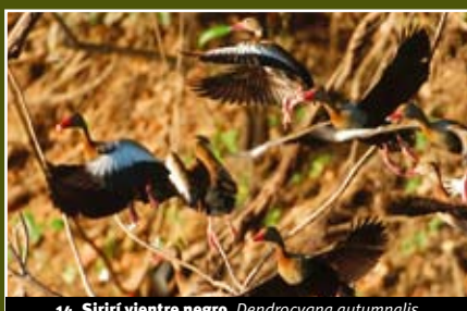
14. Sirirí vientre negro, Dendrocygna autumnalis