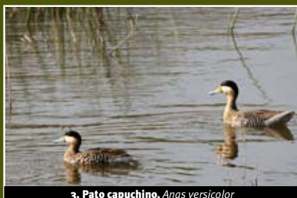
3. Pato capuchino, Anas versicolor