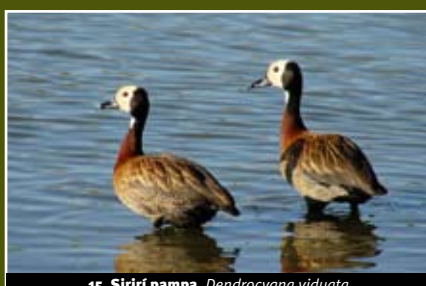
15. Sirirí pampa, Dendrocygna viduata