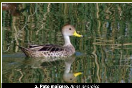
2. Pato maicero, Anas georgica